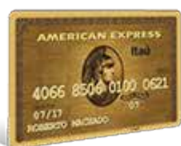
American Express Gold