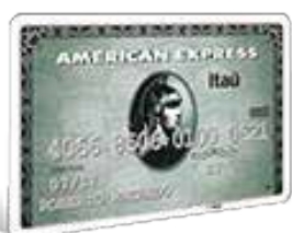
American Express Green