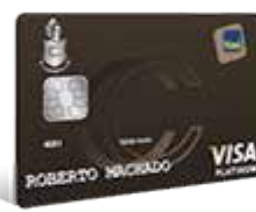
Visa Platinum Centenario