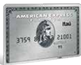
American Express Platinum